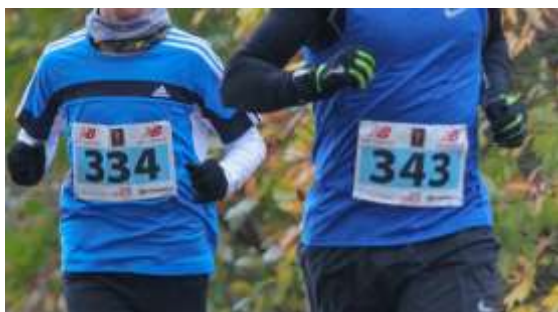
Nummerlapp på bröstet/ magen

Tidtagning sker med chip (finns i startpaketet) som fästs med kardborreband på ena vristen. Resultattiden beräknas från startskottet tills att deltagaren springer över mållinjen.