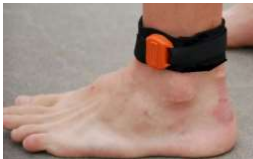
Chip runt ena vristen

Ifall deltagaren avbryter tävlingen skall chippet återlämnas till tävlingskansliet utan fördröjning. Efter fullföljd tävling tar funktionärerna hand om chippet. För ej återlämnat/borttappat chip debiteras löparen 90€.