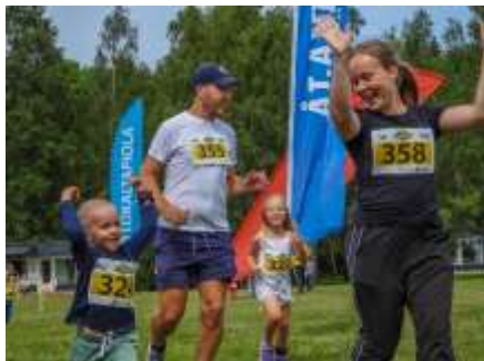
Nummerlapp på bröstet/ magen

Tidtagning sker med chip (finns i startpaketet) som fästs med kardborreband på ena vristen. Resultattiden beräknas från startskottet tills att deltagaren springer över mållinjen.