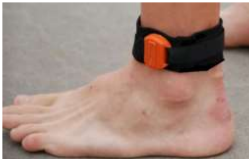
Chip runt ena vristen

Ifall deltagaren avbryter tävlingen skall chippet återlämnas till tävlingskansliet utan fördröjning. Efter fullföljd tävling tar funktionärerna hand om chippet. För ej återlämnat/borttappat chip debiteras löparen 90€.